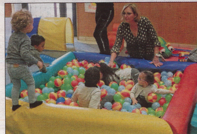
Les plus grands se sont bien amusés.