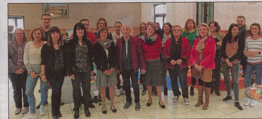
Une équipe de professionnels qui s'est beaucoup investie pour faire de cet évènement une vraie réussite.